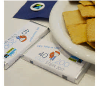
Lecker und beliebt die fair trade Steiner Schokolade