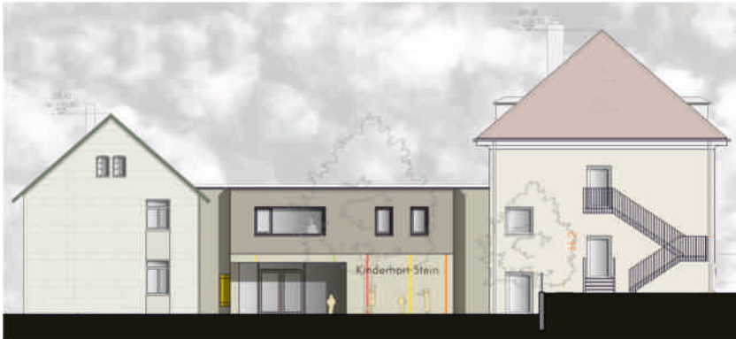
Der neue Kinderhort Stein. Ansicht von Süd-Westen