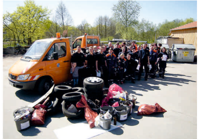
Die Sünden der Umweltfrevler belasten Natur und Umwelt

Die Stadt Stein beteiligt sich auch in diesem Jahr wieder an der Aktion "Saubere Landschaft" des Landkreises Fürth am 8. April 2017. Dabei können auch wieder alle Steiner Bürgerinnen und Bürger, sowie Schulen, Vereine und Verbände mithelfen.