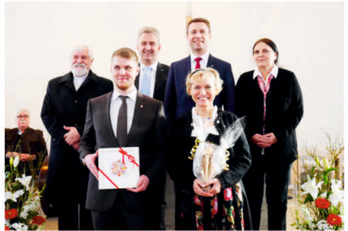
Abschiedsfeier in der St.-Albertus-Magnus Kirche