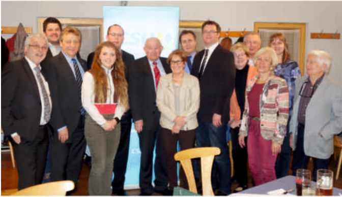
„Zugpferd“ Dr. Günther Beckstein beim CSU Ortsverband

Der Ortsverband der CSU Stein lud wieder zum Politischen Fischessen in den Schwarzen Adler in Gutzburg ein. Ein Traditionstermin in der Fastenzeit an dem man gemeinsam in geselliger Atmosphäre über politische Themen ins Gespräch kommt.