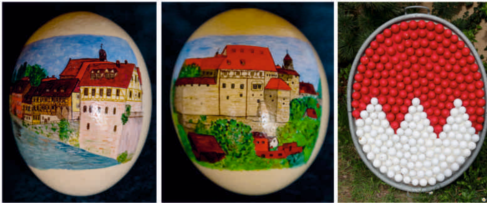
Kleine Kunstwerke aus der neuen Ostereiermotivserie „Burgenstraße“

Neben dem Osterbrunnen gibt es bereits zum 6. Mal den Ostereierweg in Gutzberg. Vom 1. April bis 1. Mai kann beides bei freien Eintritt besichtigt werden. An 10 Stationen können die von Doris Tretter handbemalten Eier entlang des Gutzberger Tals bestaunt werden. Sie malt auf Eiern von Hühnern, Tauben, Gänsen, Straußen und Emus. Insgesamt zeigen ca. 700