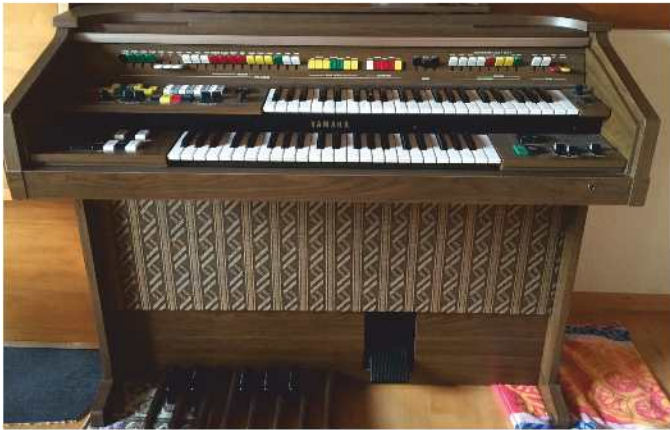
Eine der beiden Heimorgeln, die zur Abholung bereit stehen