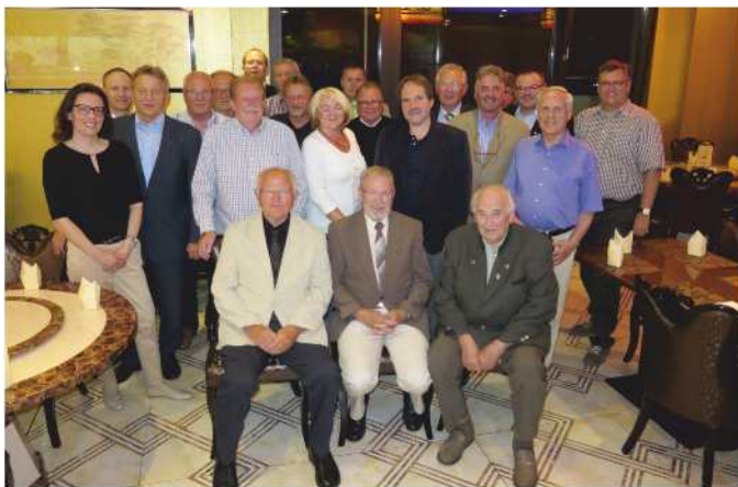
Ehrung verdienter Mitglieder

Ein Dank geht an allen Geehrten für die Treue und Unterstützung und allen Gewählten viel Spaß und Erfolg bei der zukünftigen Arbeit.