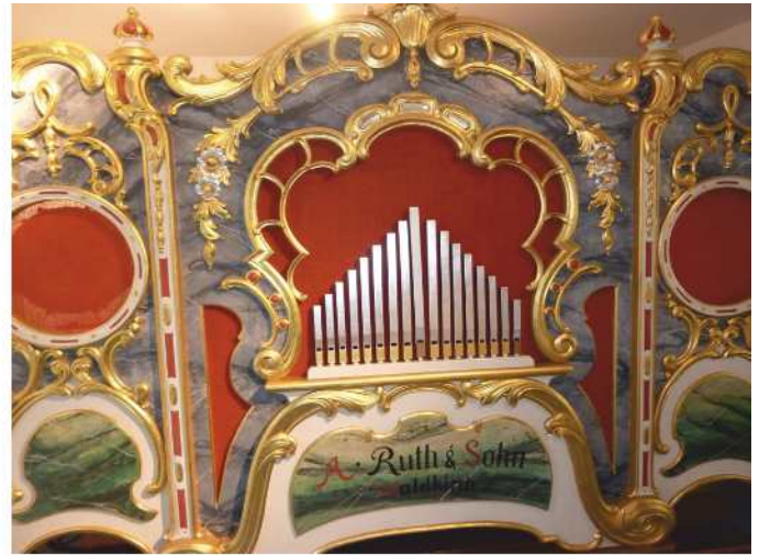
Mit über 90 Jahren, geht die 1925 in Waldkirchen gebaute Orgel, wieder auf Tour.

derkarussell nicht Halt. Viele Jahre stand die Orgel ungenutzt in einer Garage, bis im Januar 1998 der Heimat- und Kulturverein Stein diesen „alten Schatz“ wiederentdeckte. In Zusammenarbeit mit einem Restaurator-Team in Dachau und Mitgliedern des Heimat- und Kulturverein Stein, konnte die Orgel nach zweijährigen Restaurierungsarbeiten im alten Glanz und voll funktionsfähig der Steiner Bevölkerung präsentiert werden. Die Restaurierungs-Kosten