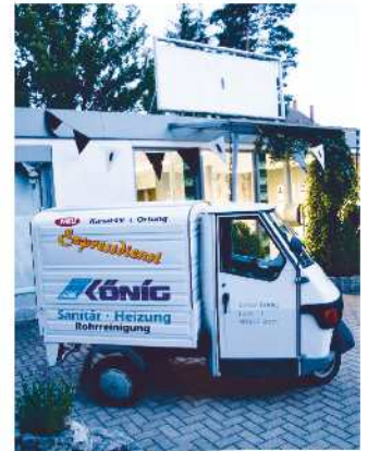
Der Piaggio vor dem Eingang zur Kunstausstellung

Bildenden Künste vom 7.-10. Juli zu sehen waren. Vor der Ausstellung parkte selbstbewusst der Piaggio der Firma König, der so selbst zum Kunstobjekt zum „Loch in Loch“, wurde.