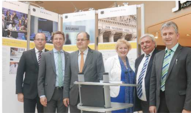
Das FORUM ist ein idealer Ort für eine Begegnung mit der Politik, betonte Bundesminister Christian Schmidt

Mit der Ausstellung unterstützt der Deutsche Bundestag seit vielen Jahren erfolgreich den Dialog zwischen den Abgeordneten und den Bürgerinnen und Bürgern. Die Ausstellung vermittelt die Aufgabe und Arbeitsweisen des Parlaments und seiner Mitglieder. Auf einundzwanzig Schautafeln wurden im FORUM Stein alle wesentlichen Informationen über den Deutschen Bundestag und seine Mitglieder gezeigt. Auf zwei Computerterminals konnten Filme, multimediale Anwendungen und der Internetauftritt des Deutschen Bundestages abgerufen werden. Viele Informationsbroschüren lagen zum