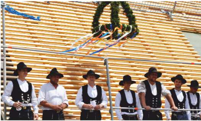
Mit dem traditionellen Zimmermannspruch wurde dem Gebäude Glück und Segen gewünscht

Die Stadt Stein wird ab Frühjahr 2017 um einen wichtigen, neuen Kulturpunkt reicher sein. Denn dann wird das denkmalgeschützte Wohnstallhaus am Asbacher Weg 3, das von der Stadt Stein für rund 1,2 Mio. Euro generalsaniert wird, fertiggestellt sein.