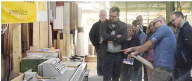
Besucherguppe bei der Werksführung „Wie entsteht ein Möbel“

Rund 200 Innungsschreiner in ganz Bayern öffneten am „Tag des Schreiners“ ihre Werkstatttüren und präsentierten hochmodernes Handwerk. Unter ihnen auch die Schreinerei Sauber am Gewerbering 18 in Stein.