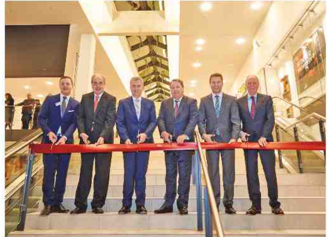
Es ist geschafft. Das FORUM Stein ist eröffnet

Punktlandung. Ohne zeitliche Verzögerung öffnete das FORUM Stein nach eineinhalbjähriger Bauzeit planmäßig am 12.11.2015 seine Türen für die Kunden. Vor zehn Jahren führte die Stadt Stein den Ideenwettbewerb für die Neubebauung des ehemaligen Möbel-Krügel-Areals durch. Vier Jahre entwickelte die sontowski & partner group die Idee des neuen Einkaufszentrums „FORUM Stein“.