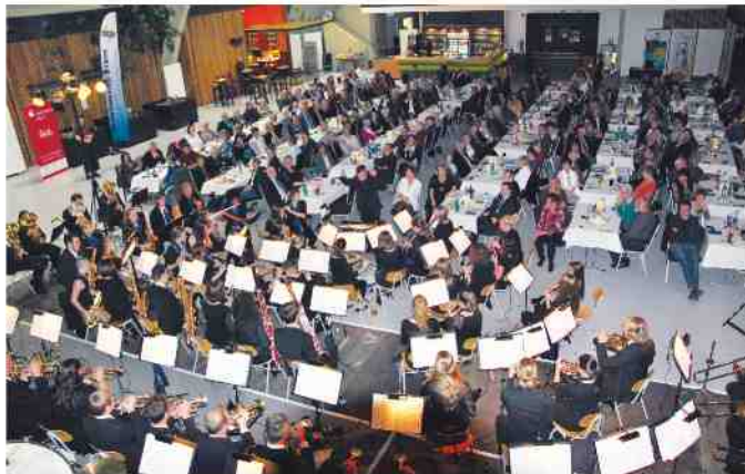
Musikalische und kulinarische Schmankerl