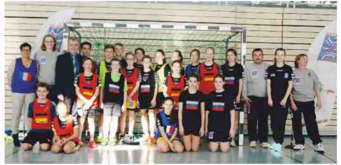
Abschlussfoto der Hummel Power-Camp Teilnehmer

Zum ersten Mal fand in Stein ein Trainingscamp für Handballer statt. Drei Tage wurden die Spieltechnik verbessert, die Kondition und die Kraft aufgebaut. Am vierten Tag fand das Hummel-Power-Camp mit einem „Vier-Länder-Turnier“ seinen Abschluss, in dem die 12-16-jährigen Mädchen und Jungs zeigen konnten, was sie gelernt haben. Von den rund 30 Teilnehmer/innen kamen 10 aus Steiner Handballvereinen, zwei der Spielerinnen reisten eigens aus München