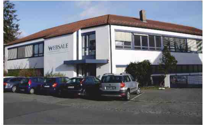
In den ehemaligen Büroräumen werden in Kürze bis zu 98 Jugendliche wohnen

Da es sich um eine Erstaufnahmeeinrichtung handelt, bedeutet dies, dass die Jugendlichen ihre ersten Wo-