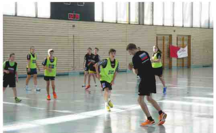
Das Camp endete mit einem „Vier-Länder-Turnier“.