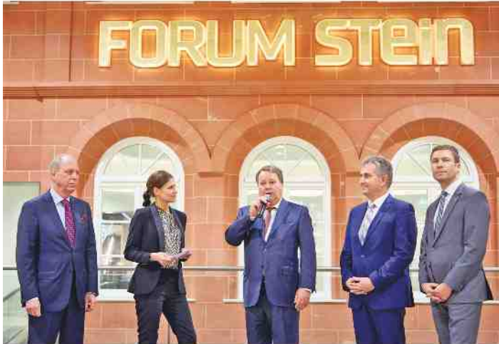
Moderierte Grußworte in Interviewform an der „Krügel-Villa“