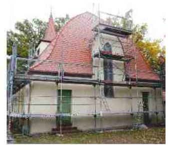
Die Jakobuskirche ist auch immer wieder das Ziel von Pilgern.

Wirkung des Kirchenbaues unterstützt. Der in seiner Architektur expressionistische Bau besteht aus einem massiv errichteten Saalbau mit geschweiftem Bohlenbinderdach und westlichem Mittel-turm.