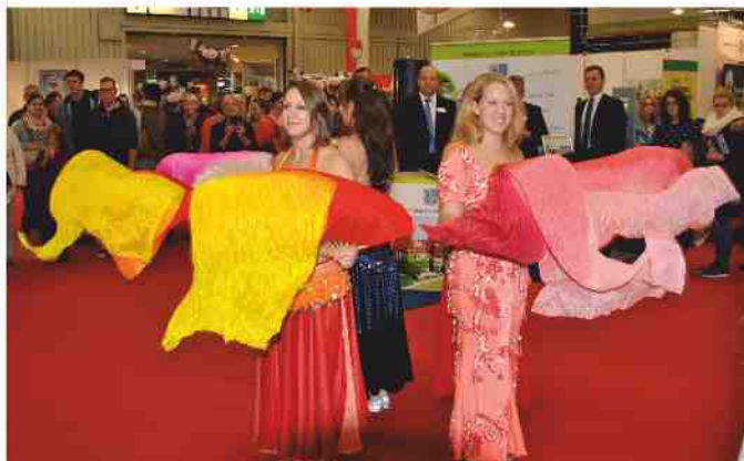
Die Töchter der Wüste zogen die Blicke auf sich

Der Landkreis Fürth war auch in diesem Jahr mit einem eigenen Stand auf der CONSUMENTA im Messezentrum Nürnberg vertreten. An jedem der Ausstellungstage präsentierte sich zusätzlich eine andere Stadt oder Gemeinde des Landkreises. Am Sonntag, 1. November hatte die Stadt Stein „ihren“ Tag und wartet mit einigen Hinguckern auf.