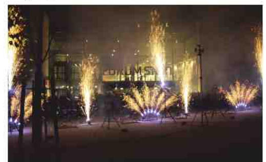
Das Grand-Opening mit „Großem Kino“ und einem brillanten Feuerwerk