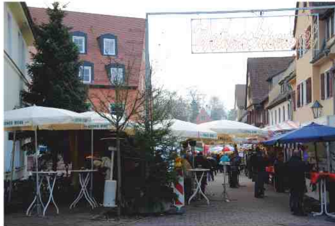
Weihnachtszauber am Mecklenburger Platz

Steiner Geschäfte und neues Einkaufszentrum FORUM im weihnachtlichen Lichterglanz - Der Steiner Weihnachtsmarkt, gemütlicher und beliebter Treffpunkt in der Vorweihnachtszeit. Die Veranstalter des Steiner Weihnachtsmarktes freuen sich auch in diesem Jahr wieder auf viele Besucher am Mecklenburger Platz.