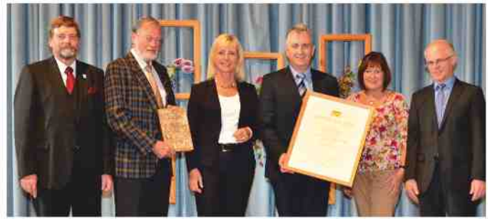
„Volle Punktzahl“ für den Steiner Friedhof

Die Stadt Stein hatte sich neben anderen Landkreis-Kommunen an dem landesweiten Wettbewerb mit dem städtischen Friedhof an der Albertus-Magnus-Straße beteiligt. Eine unabhängige Jury war von der Anlage des Friedhofes mit der neugeschaffenen Naturbestattungsanlage und dem zentralen Bachlauf sehr angetan und bewertete diesen Ort der Stille mit der höchsten Punktzahl. Die