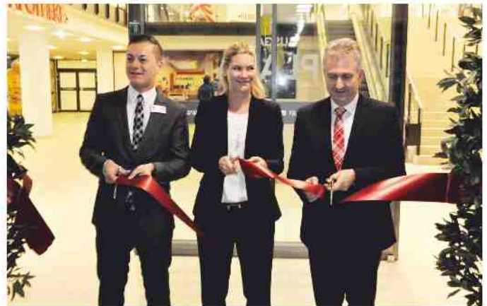
12. November 2015. Pünktlich um 7.00 Uhr wurde mit einem „Scherenschnitt“ das FORUM Stein eröffnet das am Eröffnungstag 25.000 Besucher zählte.

Die sontowski & partner group investierte rund 60 Millionen Euro in das Einkaufszentrum.