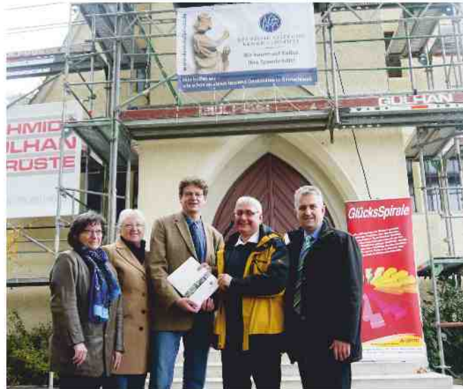
Die Fördergelder sind ein wichtiger Finanzierungsbaustein

In leicht erhöhter Lage innerhalb eines parkähnlichen Geländes wurde die Pfarrkirche St. Jakobus 1928 von dem Architekten Hans Pylipp aus Ansbach errichtet. Durch das spitzbogige Dach und den spitzen Turmhelm hat Pylipp die topografisch geprägte