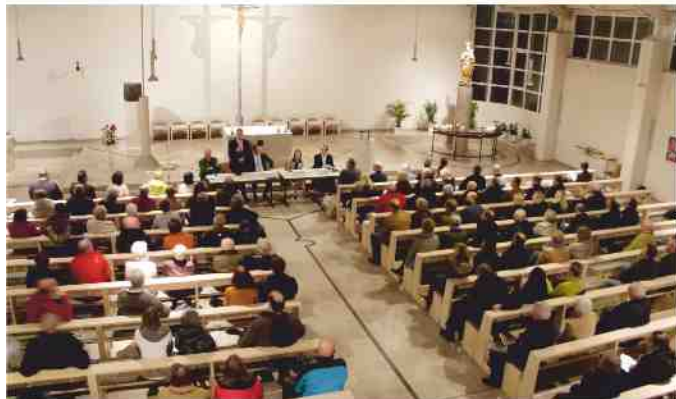
Informationsveranstaltung in der Albertus-Magnus Kirche

Dazu werden Ehrenamtliche für die verschiedensten Bereiche gesucht u.a.: