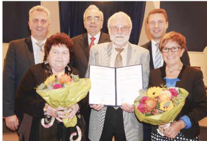
Ein großer Augenblick für den Steiner Sozialverein