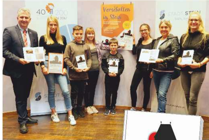
Buchvorstellung im Steiner Rathaus