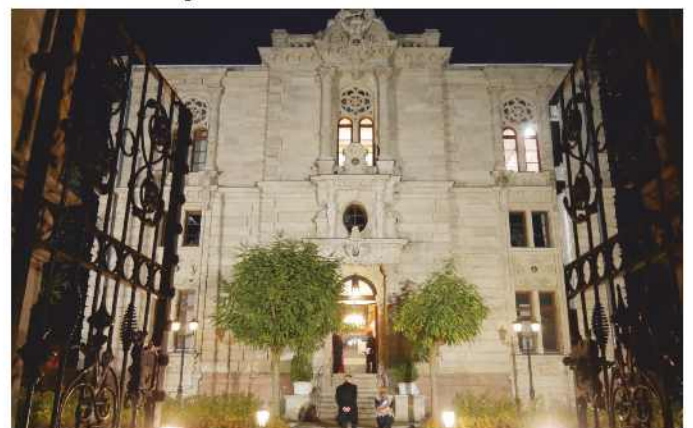
Das Fürther Logenhaus

Im Anschluss lud Emmerich zu einem Umtrunk mit Imbiss und Gespräch ein. Dabei nutzen die Gäste ausgiebig die Möglichkeit, mehr über das repräsentative Logenhaus in Fürth und die Freimaurerei zu erfahren.