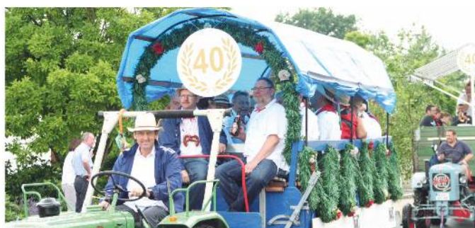
Auch in diesem Jahr erwartet die Zuschauer am Kärwasamstag wieder ein sehenswerten Festzug

Am Samstag , den 1. Juli, ab 13 Uhr findet der Kärwazug mit Festwägen, Kärwabaum und Musik statt. Gestartet wird an der „Osteria da Toni“. Von dort zieht der Festzug nach Gutzberg, Unterbüchlein weiter nach Loch und wieder zurück nach Oberweiherbuch. Unter den Festzugteilnehmern wird ein Wagen für besondere Aufmerksamkeit sorgen. Die Kärwamadli feiern ihr 30-jähriges und haben dazu einen eigenen Festwagen kreiert. Aus der