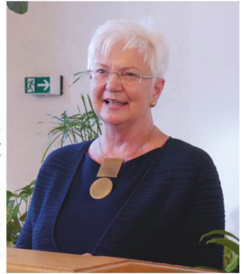
Am Rednerpult in der „Alten Kirche“ in Stein. Gerda Hasselfeldt, Vorsitzende der CSU Landesgruppe im Deutschen Bundestag.

Sie plädierte für mehr Investitionen in Bildung und Infrastruktur. Ein besonderer Schwerpunkt sei die Förderung des ländlichen Raums in Bezug auf Breitband.