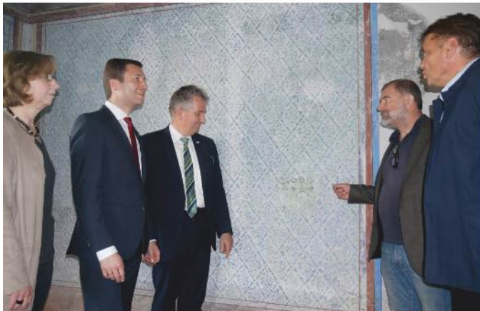
Besuch in der „Guten alten Stube“

Zehn Monate nach dem Richtfest wurde die Fertigstellung des Gebäudes Asbacher Weg 3 gefeiert.