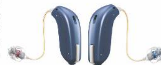
Hörsysteme Oticon Opn – mit 2,4 cm Länge unauffällig und diskret

Mit Oticon Opn erleben Sie räumliches Hören – ganz natürlich.