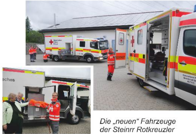
Die „neuen“ Fahrzeuge der Steinrr Rotkreuzler

Bei einem Fahrzeug handelt es sich um einen Rettungswagen, der als Ersatz für ein in die Jahre gekommenes Fahrzeug beschafft wurde. Auffälligste Neuerung gegenüber dem Vorgänger ist die Hochsichtbarkeitsbe-