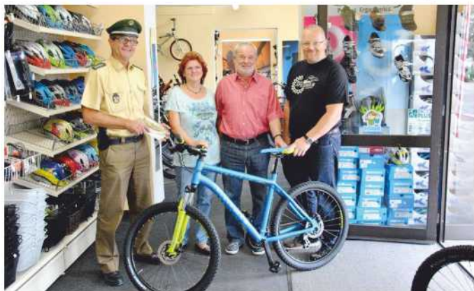
Gewinnübergabe bei Fahrrad Mlady

Auch in diesem Jahr wird das Verkehrssicherheitsprogramm 2020 „Bayern mobil - sicher ans Ziel“, mit Gewinnspiel als PR-Aktion der Bayerischen Polizei durchgeführt. Im Rahmen der diesjährigen Aktion wurde vom Bayerischen Staatsministerium des Innern eine Informationsbroschüre mit dem Schwerpunktthema „Was tun bei einem Verkehrsunfall?“ erarbeitet. Der Hauptpreis beim Gewinnspiel ist ein BMW 116 d.