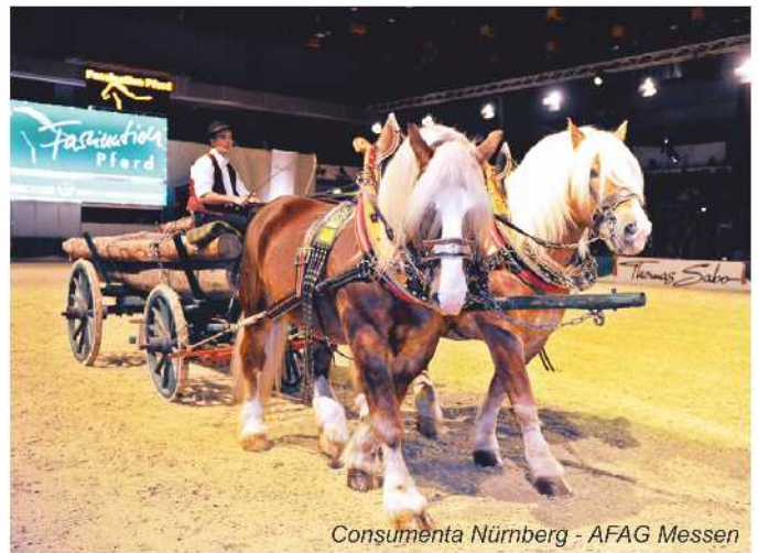
Consumenta Nürnberg - AFAG Messen

Die Jobmesse „Zukunft & Karriere“ (30. Oktober bis 1. November) bietet Tipps für Berufseinsteiger, Hilfestellungen bei beruflichen Umorientierungen und Fortbildungen sowie den direkten Kontakt zu attraktiven Arbeitgebern.