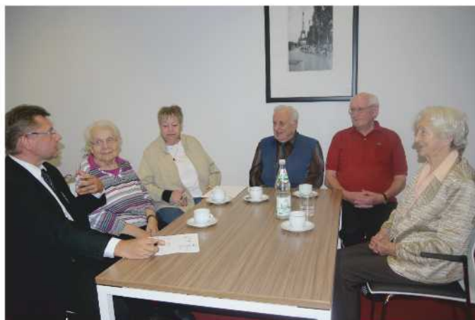
Heimbeiräte und Heimleiter im Gespräch

Alle sechs Wochen finden sie sich in lockerer Runde zusammen, um oft auch über kleine Dinge zu diskutieren oder Verbesserungen anzu-