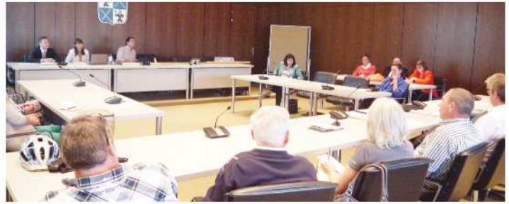
Arbeitssitzung im Steiner Rathaus

Die Steiner Gewerbetreibenden, Vereine und Akteure planen ein gemeinsames Fest, das am 14. November 2015 stattfinden soll.