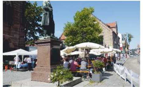
Steiner Kirchweih am Martin-Luther Platz