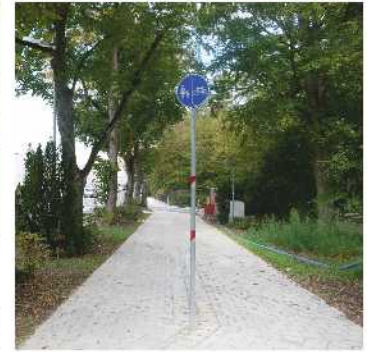
„Neue Perspektiven“ in der Deutenbacher Straße

In Hinblick auf das zu erwartende Verkehrsaufkommen mit dem neuem Einkaufszentrum FORUM Stein war eine Änderung der Verkehrssituation an der Einfahrt Deutenbacher Straße unausweichlich. Überlegungen einen Kreisverkehr zu errichten scheiterten am Raumbedarf, der für einen Kreisverkehr notwendig ist. Mit der neuen Ampelregelung an der Deutenbacher Straße können Autofahrer aus der Deutenbacher beidseitig in die Hauptstraße abbiegen. Bisher ist nur Rechtsabbiegen möglich.