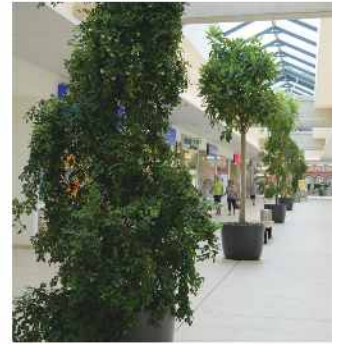
Mit viel Grün wurde im FORUM Stein eine Wohlfühlatmosphäre geschaffen

Mit Übertöpfen werden diese Pflanzen so zum perfekten Raumgestalter und lassen sich auf diese Weise wirkungsvoll mit dem Stil der Einrichtung kombinieren.