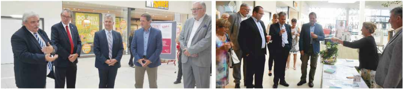
Ausstellungseröffnung auf der Plaza im FORUM Stein

16 Betriebe - darunter Handwerksbetriebe, Dienstleister und Institutionen - präsentierten im FORUM Stein zum ersten Mal ihre Produkte und Lösungen zum Ausstellungsthema: „Rund um das Heim“.