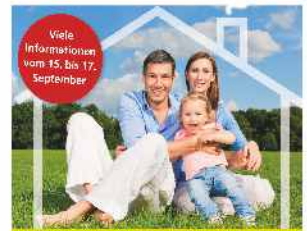
Informationstage „Rund um das Heim“