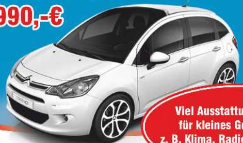
Abbildung zeigt Sonder- ausstattung