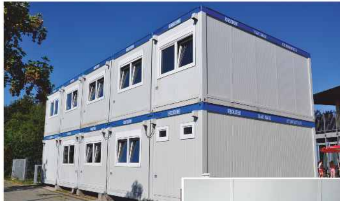
Eine Lösung auf Zeit.

Freundlicherweise hat sich Pfarrer Reiner Redlingshöfer bereit erklärt, im Evangelischen Kindergarten der Kirchengemeinde Paul-Gerhardt weitere Kindergartenkinder befristet für das Schuljahr 2016/17 aufzunehmen, um Engpässe zu vermeiden. Für die Verpflegung stehen Räume des Jugendhauses zur Verfügung. Für den Spiel- und Werkbereich ist ein Gruppenraum im 1. Obergeschoss