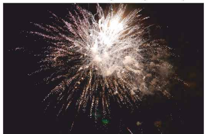
Auf Wiedersehen im nächsten Jahr.