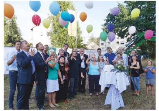
Ein guter Start mit Spatenstich und Luftballonflug.