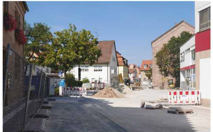
In wenigen Wochen gibt es wieder „Freie Fahrt“ in der Alexanderstraße

Im Rahmen der Altstadtsanierung wird die Alexanderstraße mit einem Kostenaufwand von rund 440.000 € umgebaut. 280.000 € fließen dabei als Förderung vom Freistaat Bayern aus Mitteln der Städtebauförderung nach Stein.