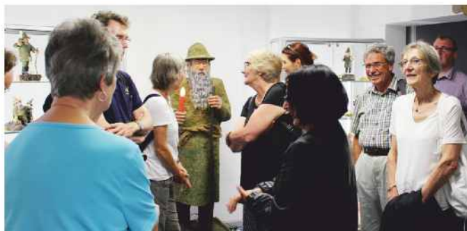
Auch Gäste aus der Schweiz fanden den Weg ins Heimatmuseum Stein. Die kleinen und großen Waldmännchen erweckten auch bei den „Eidgenossen“ Bewunderung.

Der Sage nach hilft der Moosmann - selbst in tiefster Not lebend - guten Menschen in ihrer Armut und steht jederzeit helfend zur Seite. Moosmann und Moosweibel, lebten im tiefen Wald unter Baumstämmen und in Höhlen, nährten sich kümmerlich von Wurzeln und Früchten des Waldes und kleideten sich notdürftig mit Moos und Tannenzweigen. Sie hatten nur einen Feind, den „Wilden Jäger“. Den Menschen waren die Moosleute freundlich gesinnt. Sie halfen besonders den Ar-