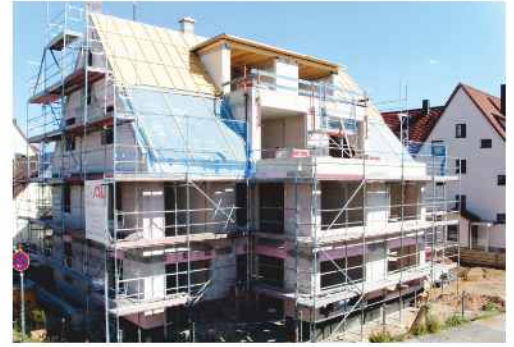
Viel Lob für das neue Wohnhaus.