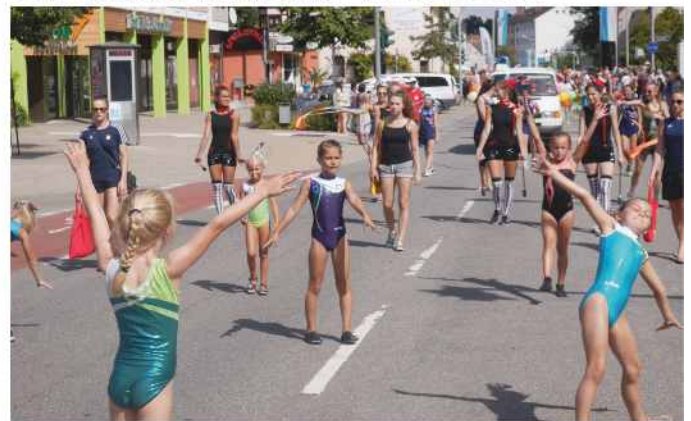
Die Mädels der Turnabteilung überzeugten die Jury.

Das große „Brillant Feuerwerk“ zum Abschluss der Steiner Kirchweih war der letzte Programmpunkt und ein Höhepunkt der Steiner Kirchweih 2016.