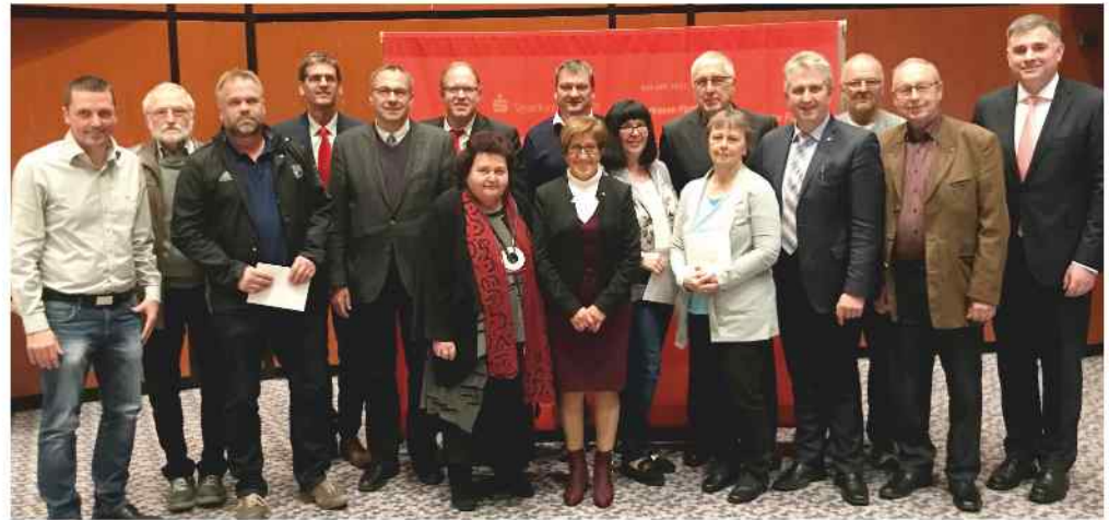
Begünstigt wurden: FC Stein, Sozialverein Lichtblick, Hilfe für Tschernobyl, STV Deutenbach, TSV Stein, RMC Lohengrin, Naturfreunde Stein, Steiner Schlossgeister

Vor 12 Jahren wurde die Stiftergemeinschaft Fürth ins Leben gerufen. Heute umfasst sie eine Vielzahl von Stiftungen, die von Sparkas-