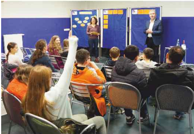
Lebhafte Diskussionen im Jugendhaus