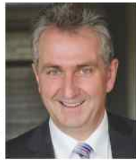
Kurt Krömer Erster Bürgermeister der Stadt Stein