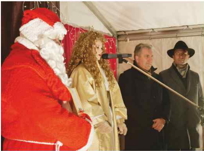
Prolog des Christkinds.

Die Eröffnung des Steiner Weihnachtsmarktes ist alljährlich ein besonderer Höhepunkt, den hunderte von Besuchern begleiten. Auch in diesem Jahr drängte sich Klein und Groß um die Bühne am Mecklenburger Platz, um zu hören was der Nikolaus zu sagen hatte und dem Prolog des Steiner Christkinds zu lauschen. Musikalisch umrahmte wieder der Posaunenchor Oberweihersbuch die Veranstaltung, die buchstäblich ins Wasser