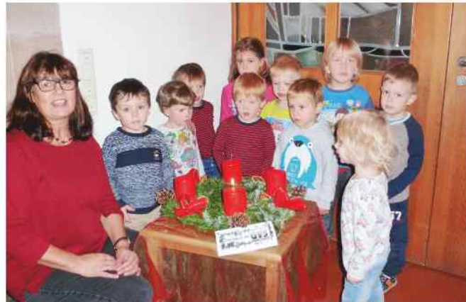
Die Überbringer der Adventskränze bereiteten große Freude.

Es gibt kein Fest, das seinen Schatten so vorauswirft wie Weihnachten. Wenn am Ende des Kalenderjahres die Tage spürbar kürzer werden und in den Geschäften die ersten Lebkuchen auftauchen, dann beginnt bei Klein und Groß die große innere Unruhe. Die Zeit des Wartens. Wann ist es endlich soweit? Ungeduldig warten die Kinder auf den großen Außenblick. Das war auch vor 180 Jahren, im „Rauhen