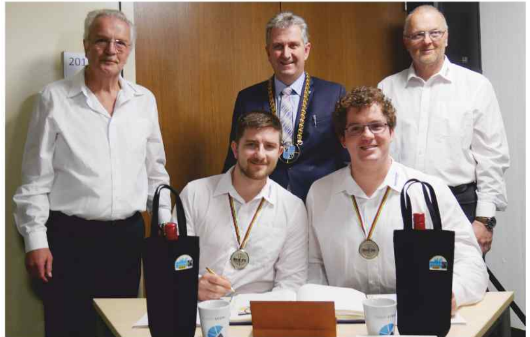
Eintrag ins Goldene Buch der Stadt Stein

Als echte Sportler gratulierten sie dem österreichischen