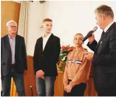
Interview mit den Hauptdarstellern des Films.