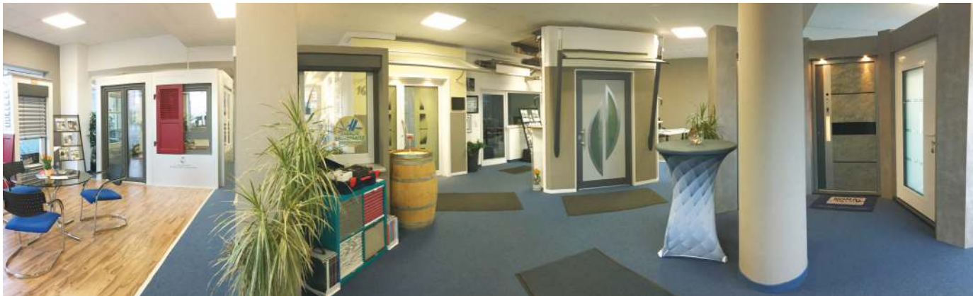
Ein Blick in die FEBRU PLUS Ausstellung

Samstag „Late Night Shopping“ bis 20.30 Uhr Lassen Sie sich inspirieren