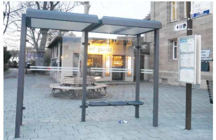
Der neue Fahrradständer mit Aufbewahrungsboxen (Foto li) wird direkt an die Bushaltestelle (Foto re.) „angedockt“

Die Stadt Stein wurde im Oktober des vergangenen Jahres im Festsaal auf Schloss Dachau als „Fahrradfreundliche Kommune in Bayern“ ausgezeichnet. Ein Prädikat, das sie mit 65 anderen Städten teilt.