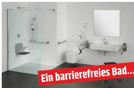
Ein barrierefreies Bad...