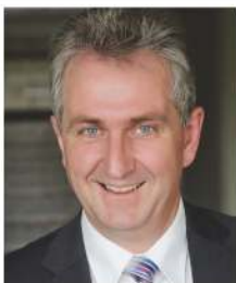
Kurt Krömer Erster Bürgermeister der Stadt Stein