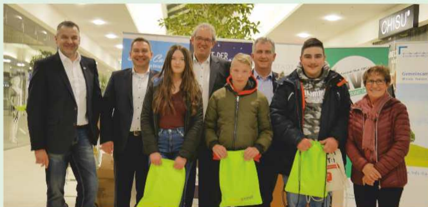
Die drei Hauptpreisträger der Nacht der Ausbildung in Stein.

Die nächste Nacht der Ausbildung in Stein findet am 20.03.2020 statt.