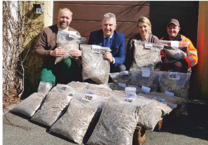
Das Saatgut „Mössinger Blumenträume“ lässt Steiner Blumenwiesen erblühen

Nach der Einsaat bleiben die Blumenwiesen ganz allein der Natur überlassen. Sie müssen damit fertig werden, wenn es zu heiß oder zu nass ist. Sie folgen den Gesetzen der Natur, die ideale Standorte fördert, andere wieder bis zum Totalausfall führt. Blumenmischungen sind so zusammengestellt, dass es das ganze Jahr über blüht. Das Ende der Blütezeit der einen Blume ist gleichzeitig der Beginn einer anderen Blume. Mohn, Kornblumen, Sonnenblumen... alles blüht auf den Steiner Blumenwiesen, die als beliebtes Steiner Fotomotiv weithin bekannt sind. Vor allem sind es heimische Blumen die den Blick erfreuen. Um im Wechsel der Jahreszeiten von Frühling bis Herbst durchblühen zu können, helfen auch nicht-heimische Blumen aus. Mit Beginn der Blütezeit gibt es ein wahres Futterangebot für