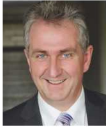
Kurt Krömer Erster Bürgermeister der Stadt Stein