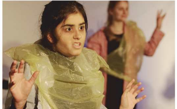
Das Schicksal von Flüchtlingen emotional vor Augen geführt

Bei der Flüchtlingspolitik geht es letztlich nicht um die offizielle Frage nach dem Umgang mit den Migranten, also um die Frage nach Integration oder Abschiebung, sondern um die per-