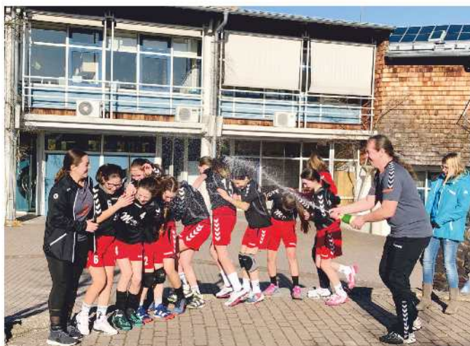
Sektdusche für Handballerinnen

Angefangen hat die Erfolgsgeschichte bereits vor knapp einem Jahr, als sich die Handballabteilungen der DJK Eibach und des TSV Stein dazu entschlossen haben im Jugendbereich zusammen zu arbeiten. Dass in der ersten gemeinsamen Saison bereits die Meisterschaft auf dem „Haben-Konto“ verbucht werden kann, konnte zu diesem Zeitpunkt noch Niemand ahnen. Schließlich musste der neu zusammengewürfelte Haufen aus talentierten Spielerinnen in wenigen Monaten zu einer Mannschaft geformt werden. Offensichtlich ist dies dem Trainerteam (Ma-