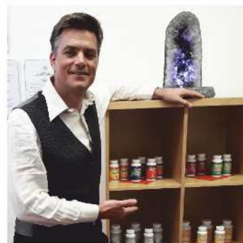
Orthobio GmbH Mühlstr. 50, Stein