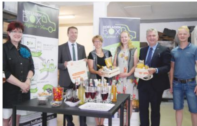
Umzugsfeier mit Verkostung in Stein, Am Fuchsbrunnlein. Hier befindet sich jetzt die neue Zentrale der „Hofladen-Box“.