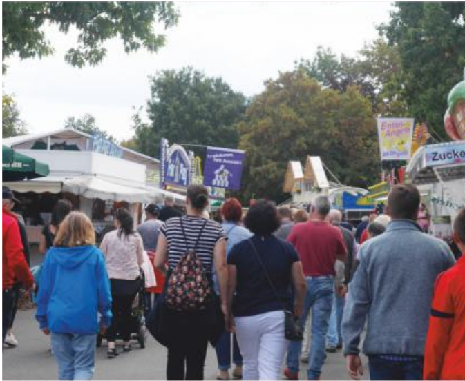
Viele Besucher genießen das Flair und die Atmosphäre am Steiner Kirchweihplatz