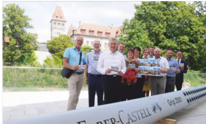
Die Bürgermeister der Kommunalen Allianz vor dem Steiner Schloss, das zugleich Bildelement der neuen Postkarte ist.

Gemeinsam lässt sich mehr erreichen. Das zeigen die Allianz-Kommunen auch auf ihrer Postkarte mit den Kirchen in Großhabersdorf, Ammerndorf, Roßtal, Alt-Oberasbach und Zirndorf sowie die Erlebnisburg in Cadolzburg und das Schloss Faber-Castell. Die Gemeinden der Region konnten ihre historische, mittel- bis klein-