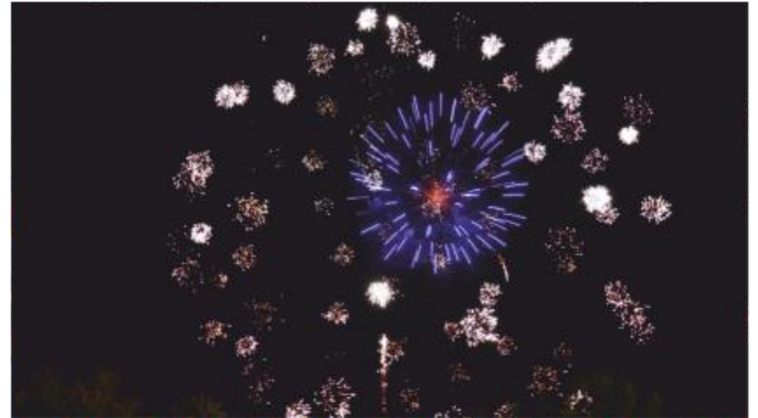
Atemberaubende Lichter am Himmel