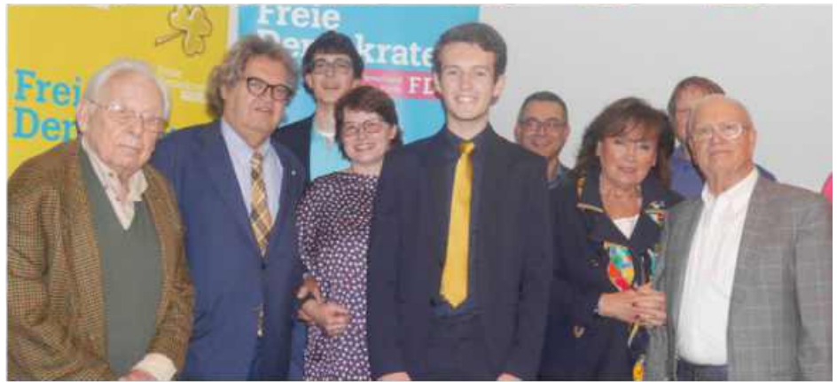
gemeinsam mit der Steiner FDP

Zum traditionellen Neujahrsempfang in Stein in der Alten Kirche haben die mittelfränkischen Liberalen immer prominente Redner zu Gast. Dieses Jahr war mit dem Medienprofi Helmut Markwort ebenfalls ein politisches Schwergewicht angekündigt. Aus gesundheitlichen Gründen musste der Termin mehrmals verschoben werden. Vor kurzem war Markwort in Stein zu Gast um den Termin nachzuholen. Die Veranstaltung fand im Saal des Müttergenesungswerkes statt, da die Alte Kirche wegen Umbaumaßnahmen nicht zur Verfügung stand.