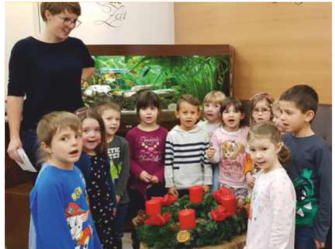
Für die drei „Adventskranzkurlere“ gab es von den Kleinen ein extra Weihnachtslied.

Das Warten aufs Christkind ist für Kinder eine unheimlich lange Zeit. Nur langsam vergehen die Tage während die Anspannung steigt und steigt.