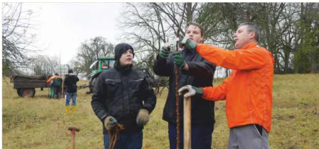
Fachkundige Anweisung für einen perfekten Baumschnitt

Der „Höllgarten“ in Stein entlang der Stuttgarter Straße umfasst rund 5 ha, eine Liegenschaft, die zur Erbgemeinschaft Faber-Castell gehört. Am westlichen Ende des Geländes befindet sich der naturnahe Kindergarten „Höllgarten“ im Osten liegt das Gewerbegebiet.