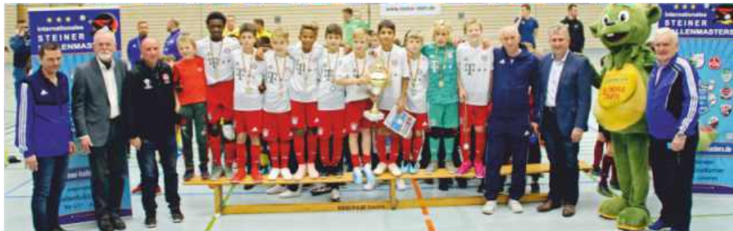
Der FC Bayern wurde als die beste Turnierrmannschaft ausgezeichnet.

Eine Wochenende „Fußball satt“ in der Sporthalle des Gymnasium Stein. Viele Gäste auf der Zuschauertribüne erlebten packende Duelle und zum Teil hochdramatische Spiele. Das erste internationale U11 Steiner Hallenmasters und auch der erste HM-Cup feierten einen phantastischen Einstieg.