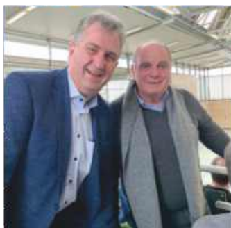
Uli Hoeneß in Stein.