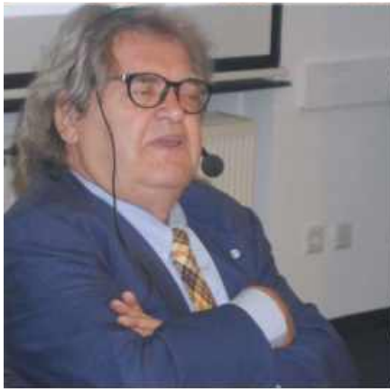
Helmut Markwort ...