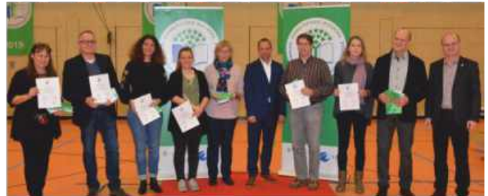
Preisverteilung in Eggolsheim durch Staatsminister Thorsten Glauber.

verzichten, in der Mensa und im Pausenverkauf nur fleischlose Gerichte angeboten wurden und in der Aula des Gymnasiums eine Begleitausstellung zum Thema Fleischkonsum und seine Auswirkungen vom P-Seminar „Planet Earth First“ gestaltet wurde. Eine Unterrichtseinheit zum Thema „Plastikmüll“ im Rahmen des Religions- und Ethikunterrichts der 6. Klassen (mit anschließender Müllsammelaktion rund um das Schulhaus), die Veranstaltung eines nachhaltigen Bastelnachmittags in der Weihnachtszeit für SchülerInnen der 5. und 6. Jahrgangsstufe sowie das Designen von Up-