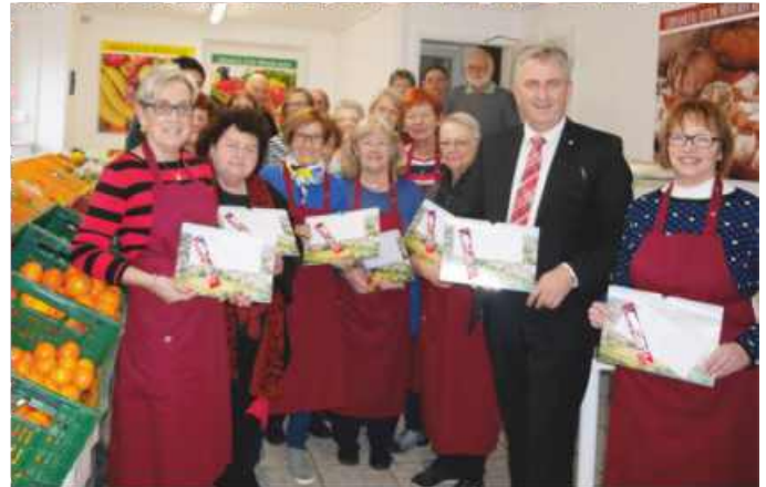
Würdigung der ehrenamtlichen Helfer.