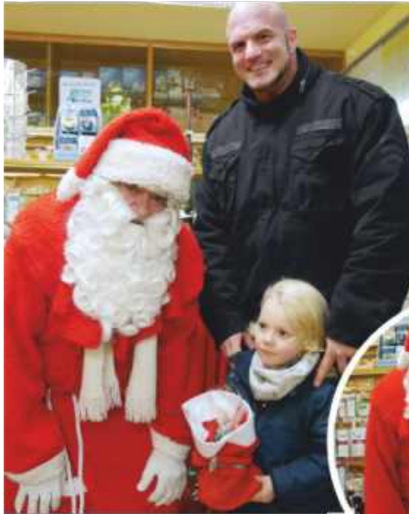
Ein respektvolles und auch freudiges Zusammentreffen mit dem Nikolaus