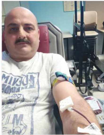
Nur ein kleiner Pieks

Die Spender werden über eine Einlasskontrolle zum Blutspenden vorgelassen, was eine Schlangenbildung bei den zu erwarteten über 100 freiwilligen Blutspendern zur Folge haben wird. Gilt doch auch hier: der Mindestabstand von Person