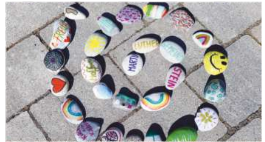
Wie groß sie wohl werden wird? Das KiGO-Team ist gespannt und freut sich auf Unterstützung.

Die Mitarbeitenden des Kindergottesdienstteam laden herzlich ein, ein Zeichen der Gemeinschaft und Ermutigung zu setzen. Man kann zuhause einen Stein bemalen oder mit einem Spruch beschriften und diesen zwischen Martin-Luther-Kirche und Gemeindehaus zu einer Spirale legen.