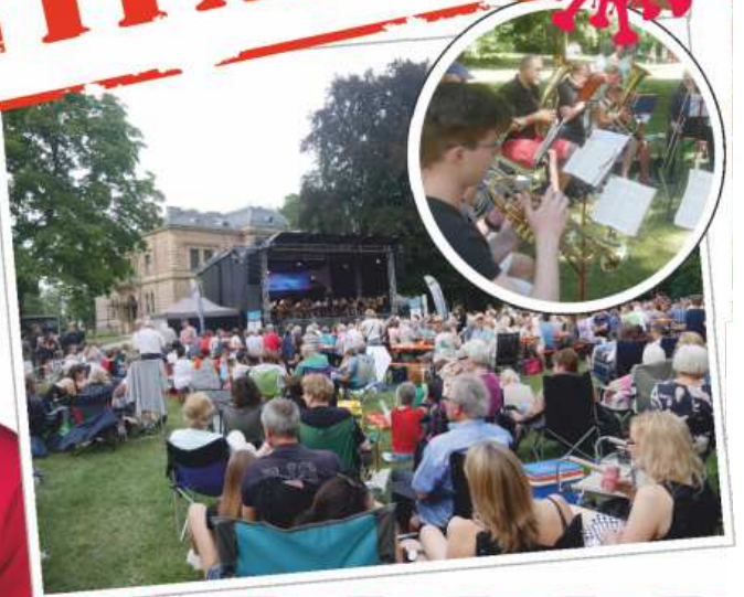
Stadtfest, Schloßkonzert, „Der Stadtpark klingt“, Kirchweih... – alles abgesagt.