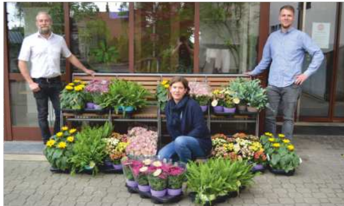
Spendenübergabe im Caritas-Seniorenheim

Aktuell sind es insbesondere kranke und ältere Menschen, die BAUHAUS besonders am Herzen liegen. Denn gerade sie zählen zu dem Personenkreis, der gegenwärtig von den verhängten Besuchs- und Kontaktverboten in den Alten- und Pflegeeinrichtungen am stärksten betroffen ist. Häusliche Isolation und nur wenige soziale Kontakte gehören gegenwärtig dort zum Alltag.