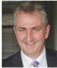
Kurt Krömer Erster Bürgermeister der Stadt Stein