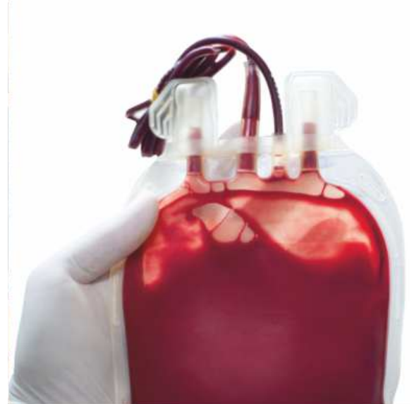
Blut kann Leben retten

zu Person beträgt 1,5 Meter. Unter ärztlicher Kontrolle werden Fieber gemessen und Gesundheitsfragen gestellt. Die Brotzeit nach dem kleinen „Pieks“ als kleines Dankeschön für die Blutspende fällt aus. „Stattdes-