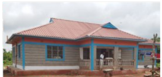
Das neugebaute Kinderheim