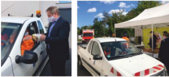
Essen to go für die „Alltagshelden“

Unmittelbar neben der Parkhauseinfahrt wurde ein Drive-in eingerichtet, für die Helden des Alltags. Das Ziel: den Helden des Alltags mit einer warmen Mahlzeit „Danke“ zu sagen. Sie sind jeden Tag für uns da und haben zur Zeit den wohl härtesten Job der Welt – unsere Helden des Alltags. Ob Feuerwehrleute oder Polizisten, Pfleger, Verkäufer, Paketboten, Ärzte, städtische Mitarbeiter, Laboranten, Mitarbeiter der Versorgungs- und Entsorgungsbetriebe, Krankenwagenfahrer und Rettungskräfte, THW'ler, alle Mitarbeiter in den systemrelevanten Betrieben (m/w/d), Krankenhäuser und Pflegeeinrichtungen und in den Geschäften des FORUM Stein – sie alle geben ihr Bestes, damit wir auch in dieser besonderen Zeit sicher sind, ausreichend zu essen und zu trinken haben, kurzum unser Alltag funktioniert. Dafür haben sich die Verantwortlichen des FORUM Stein etwas Besonderes einfallen lassen. Sie haben alle Helfer des Alltags zu einem kostenfreien Essen