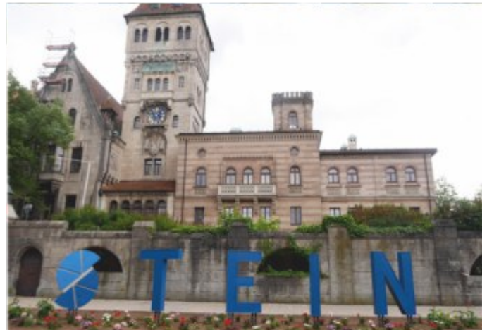
Die neue Optik am Steiner Schloss

Wenn man von Nürnberg kommend nach Stein fährt, fällt es auf – das neue Steiner-Logo am Steiner Schloss, das mit großen Lettern darauf hinweist, dass man jetzt in die Faberstadt einfährt. Vor der prächtigen Kulisse des Faber Castell'schen Schloss, das zu den sieben schönsten Schlössern Deutschlands (neben Schloss Neuschwanstein und der Würzburger Residenz...) zählt, ist die enge Verbundenheit zu Stein unübersehbar. Stein gewinnt damit eine neue selbstbewusste Identität. Eine neue Attraktivität für alle Steiner-Besucher und Influencer. Aufgebaut und gestaltet wur-