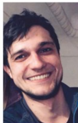
Gebäudereinigung Wolf Leonrodweg 6, 90547 Stein

Der Meisterbetrieb Gebäudereinigung Wolf wurde im Jahr 2017 gegründet. Aktuell beschäftige ich einen von mir selbst ausgebildeten Gesellen im Gebäudereiniger-Handwerk.