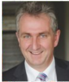
Kurt Krömer Erster Bürgermeister der Stadt Stein