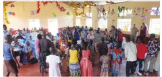
Treffpunkt im Gemeindehaus