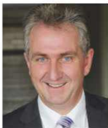
Kurt Krömer Erster Bürgermeister der Stadt Stein