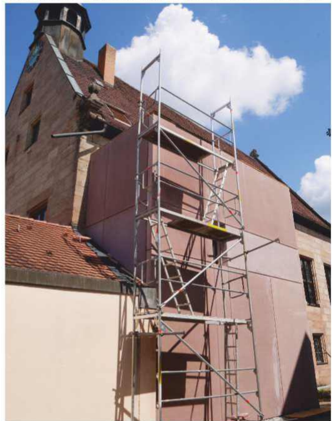
Der neue Anbau für den Aufzug an der Alten Kirche.