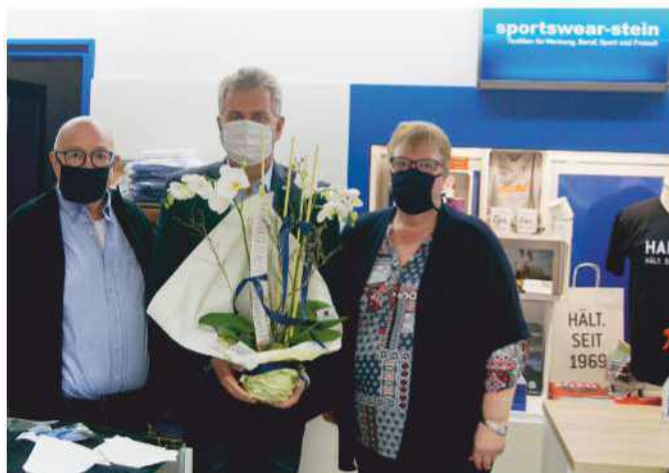
Gratulation zur Neueröffnung.