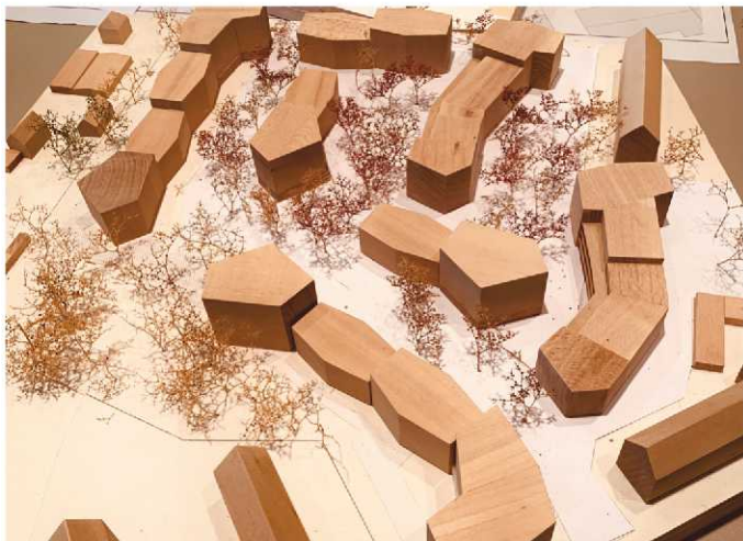
Neue Chance für den Bebauungsplan Krügel

Die Gebäude auf dem ehemaligen 2,5 ha großen Krügel-Gelände sind alle abgebrochen und bieten seit knapp einem Jahr ein große Freifläche. Eine großes Areal, das ungeduldig bereit