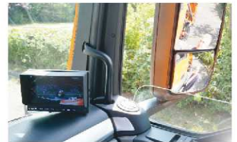
Optische und akustische Warnung wenn sich eine Person im Toten Winkel befindet

einsehbaren Bereich ein Radfahrer oder auch Fußgänger befindet, schaltet ein Warnlicht von Grün auf Rot. Überdies gibt es ein Warnsignal das den Fahrer auf die Gefahr aufmerksam macht. Bei dem LKW des Bauhofes ist ein Video-Abbiegeassistent mit Lenkwinkelsensor verbaut. Die Kosten