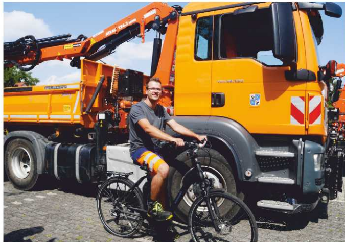
Rechtsabbiegender LKW können mit dem Abbiegeassistenten Radfahrer nicht mehr übersehen

Ausgestattet ist der LKW der Stadtgärtnerei mit einem Kamera-Monitor-System, bei dem die Kamera auf der Beifahrerseite den Toten Winkel abdeckt und sich