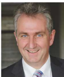
Kurt Krömer Erster Bürgermeister der Stadt Stein