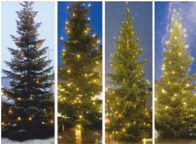
Strahlendes Kerzenlicht sorgt für Glanz am Weihnachtsbaum

Weihnachtsbäume bilden den Glanz von Weihnachten ab. Wo immer sie auch stehen berühren sie die Herzen der Menschen. Als geschmückte Exemplare begeistern sie alle Bürger. Seit vielen Jahren werden vom Bauhof Stein vier Weihnachtsbäume aufgestellt.