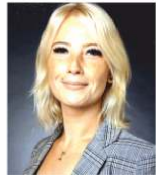
Zedan-Handke Dienstleistungen Hauptstraße 12, Stein

Das kombinierte Leistungsangebot von Zedan-Handke Dienstleistungen & Schlüsseldienst-Nürnberg24 mit Unternehmenssitz in Nürnberg bietet für jedes Problem die passende Lösung. Mit den vier Geschäftsbereichen Gebäudereinigung und Hausmeisterservice, Schlüsseldienst und Winterdienst ist das mittelständische Unternehmen in der gesamten Region von Nürnberg das ganze Jahr hindurch ein verlässlicher Ansprechpartner für Privatkunden und gewerbliche Auftraggeber gleichermaßen. Abgerundet wird der Handwerks- und Dienstleistungsservice mit fachlichen Schlosserarbeiten, mit Sicherheitstechnik für Haus und Wohnung sowie mit einem 24h Schlüsselnottdienst an 365 Tagen im Jahr.