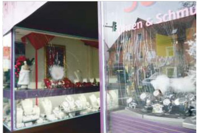
Mit einem Hammer wurde vergeblich versucht die Panzerscheibe einzuschlagen

Wir wünschen besinnliche und frohe Weihnachtstage und ein gesundes neues Jahr!