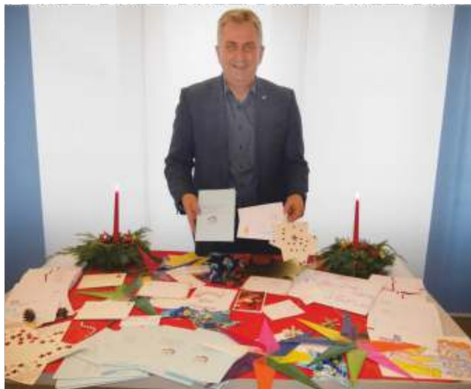
Viele Weihnachts-Grüße an die Senioren.

Die Weihnachtsbotschaften galten insbesondere den Bewohnern der drei Steiner Seniorenhäuser. Mit Unterstützung der Stadt Stein wurden Kinder aufgefordert