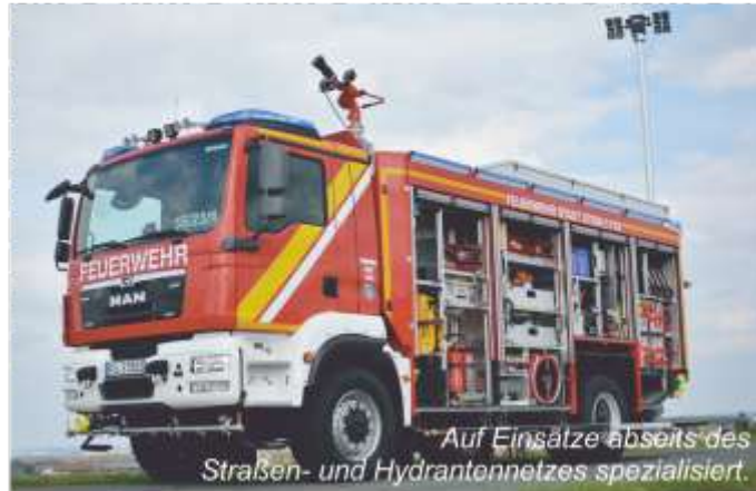
Auf Einsätze abseits des Straßens- und Hydrantennetzes spezialisiert.

Abhilfe kann hier ein Tanklöschfahrzeug (TLF) schaffen, wie es seit Kurzem bei der Feuerwehr Stein stationiert ist. Es ist vor allem für große Brände in Gebieten vorgesehen, die abseits des Straßen- und Hydrantennet-