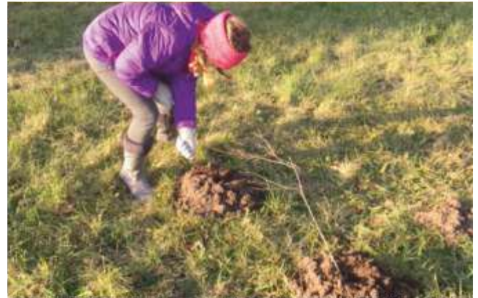
Die Ortsgruppe Stein hat sich für die kleinen Entdecker viel einfallen lassen. Beim "Maulwürfe finden" war Ausdauer gefragt.

In der Schatzkiste wartete im März ein Osterpäckchen mit Anleitung und Zubehör zum Ansäen auf der Fensterbank, natürlich mit einem kleinen Gruß vom Osterhasen.