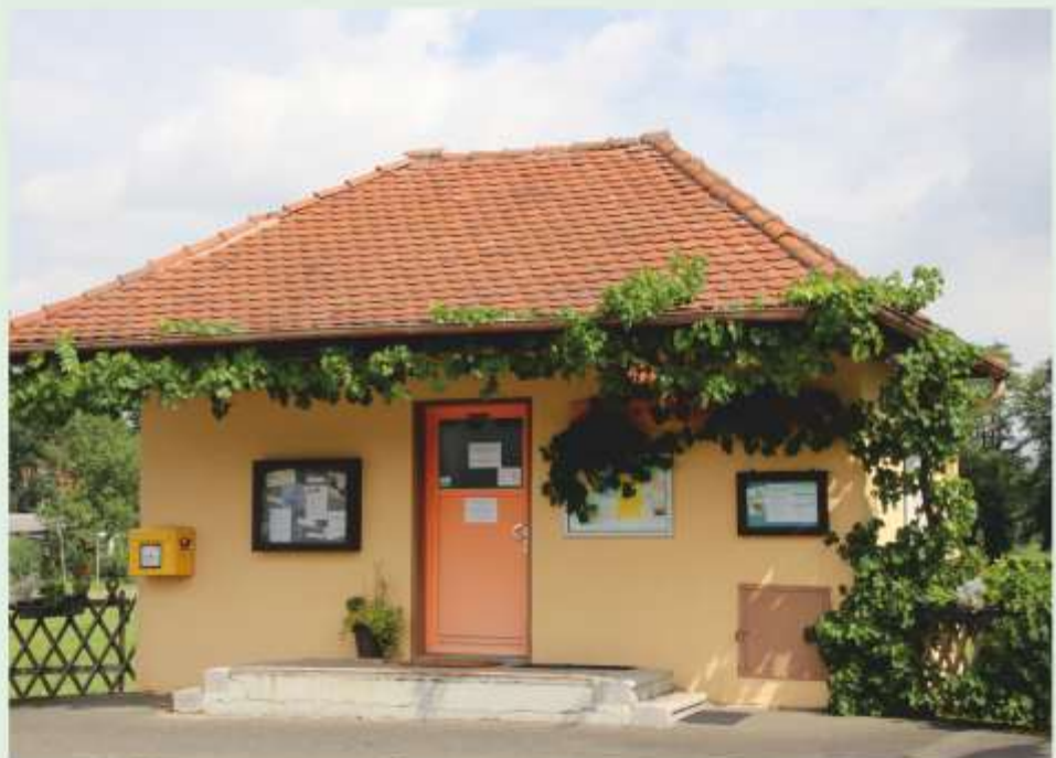
Das ehemalige Milchhäusla in Oberweihersbuch

Es gibt Grund zum Feiern. Der kleine EineWeltLaden in Stein-Oberweihersbuch im ehemaligen Milchhäusla wird 30 Jahre alt.