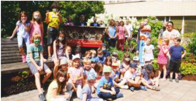
Viele Steiner Kinder haben beim "musikalischen" Insektenhotel tatkräftig mitgeholfen.

Ein Insektenhotel der ganz besonderen Art gibt es ab sofort vor dem Steiner Rathaus zu bewundern. Bei der offiziellen Vorstellung mit Bürgermeister Kurt Krömer sowie Landrat und Vorsitzender des Kreisverbandes für Gartenbau und Landespflege Fürth e.V. Matthias Dießl, war die Begeisterung groß: "Es ist einfach wunderbar, was hier alle Beteiligten geschaffen haben. Ein tolles