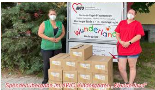
Spendenübergabe im AWO Kindergarten „Wunderland“