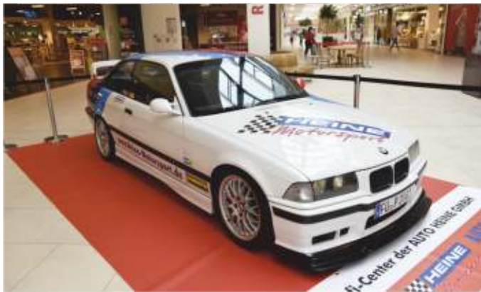
Heine-Motorsport warb im FORUM für die Classic-Rallye