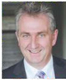
Kurt Krömer Erster Bürgermeister der Stadt Stein