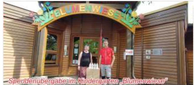
Spendenübergabe im Kindergarten „Blumenwiese“

Richtung. Während das Gymnasium Stein aufgrund der unmittelbarer Nähe zu BAUHAUS als Spender „gesetzt“ war, gestaltete sich die Auswahl anderer Einrichtungen aufgrund von besonderen Beziehungen der Institutionen zu BAUHAUS-Mitarbeiter. So wurde beispielsweise der AWO Kindergarten berücksichtigt, den die Tochter einer Mitarbeiterin besucht. Auch beim AWO-Helm gibt es solche Verbindungen.