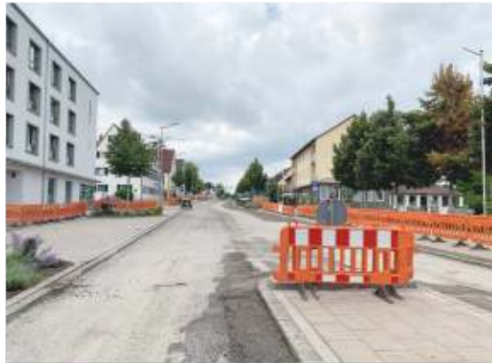
Rund drei Wochen dauern die Baumaßnahmen in der Hauptstraße.

Als der Flüsterasphalt 2009 auf der Hauptstraße in Stein erstmals eingebaut wurde, war dies eine Maßnahme des Staatlichen Bauamts Nürnberg. Geringere Laut-