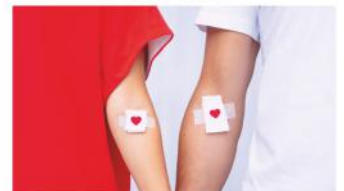
Spende Blut – rette Leben

Nächster Blutspendetermin in Stein ist am Mittwoch, 25. Mai von 16.30 - 20.15 Uhr im BRK-Haus, Hauptstr. 69 a. Nutzen Sie die Online-Termin-Reservierung unter: blutspendedienst.com/stein Bitte Ausweis und falls vorhanden Blutspendeausweis mitbringen.