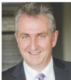
Kurt Krömer Erster Bürgermeister der Stadt Stein