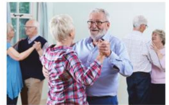
Tanzen macht nicht nur Spaß, es hält auch Körper & Geist fit.

Der Bundesverband für Seniorentanz bietet an beiden Messetagen jeweils um 12 Uhr und um 16 Uhr auf der Aktionsfläche vor der Villa mitten im FORUM Stein, einen ErlebnisTanz zum Mitmachen an.