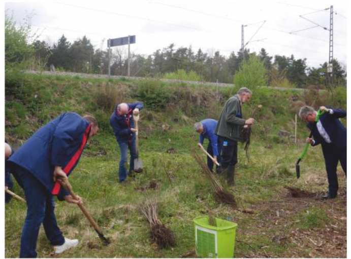
Baumpflanzung für eine klimaneutrale "Metz"

irgendwo eine Pflanzaktion zu starten, um die ganze Metz klimaneutral zu gestalten. Dazu gehören auch die Broschüren und Flyer, die für die Metz gestaltet wurden. Wir sind ganz vorne dabei, wenn es um die Klimaneutralität geht, „damit die Metz weiterlebt.“ Und die Stadt Stein leistet im Hinblick auf den Elektroausgleich großes Engagement, so Lingl. Am Bahndamm des Waldsportplatzes hatte die Bahn Kiefern entfernt, da sie mit der Trockenheit nicht mehr zurecht kamen. Und auf diesen Gelände fanden die Neupflanzungen statt. Robuste Sorten sollten an ihre Stelle treten. Esskastanien, Speyerling, Eberesche und Sommerlinden wurden im Abstand von 1,5 Metern gepflanzt. Zusätzlich wurde jede fünfte Lücke mit einer Sommerlinde belegt. Die möglichen Standorte wurden mit rot markierten Spraypunkten fixiert, die vorher