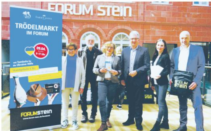
Spendenübergabe im FORUM Stein

Zum Trödelmarkt im Forum Stein fanden sich viele Interessenten ein. Nur private Trödler waren zugelassen. "Das war uns sehr wichtig", so Centermanager Fuchs. In erster Linie war es Kleidung, die angeboten wurde. Als Gebühr entrichteten die Aussteller 10.- € an den Betreiber des Trödelmarktes.