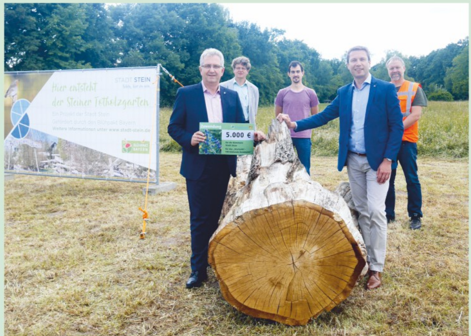
Ein Eichenstamm. Das erste Exponat des Totholzgarten.

Das Projekt „Starterkit – 100 blühende Kommunen“ wurde zum ersten Mal ausgerufen. Hierfür gibt es nach Möglichkeit nur für eine Kommune je Landkreis den Zuschlag und eine finanzielle Starthilfe von 5000 Euro. Erster Bürgermeister Kurt Krömer ist stolz, dass Stein hierfür ausgewählt wurde und in diesem Zuge 2000 m 2 für eine insektenfreundliche Fläche zur Verfügung stellt: „Unsere Mitarbeiter:innen der Stadtgärtnerei haben einmal mehr gezeigt, mit wie viel Herzblut sie ihrer Arbeit nachgehen. Es ist eine großartige Leistung, sich hier als einzige Kommune im Landkreis durchzusetzen. Daher möchte ich mich beim gesamten Team ganz herzlich für diesen Einsatz bedanken.“ Krömer nahm beim 1. Allianztag des Blühpakt Bayern das Starterkit persönlich von Thorsten Glauber, Bayerischer Staatsminister für Umwelt und Verbraucherschutz, entgegen.