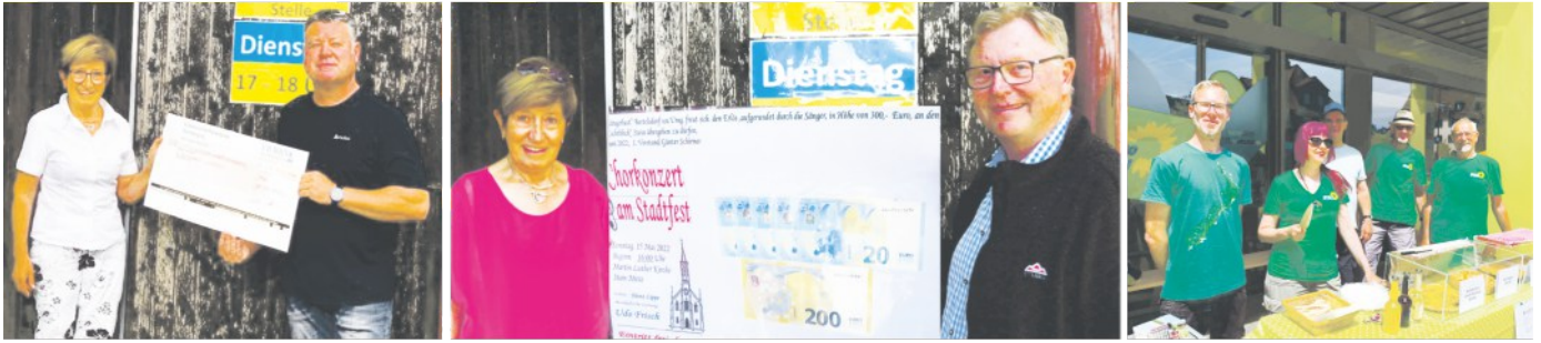
Sie alle spendeten für die Ukrainehilfe