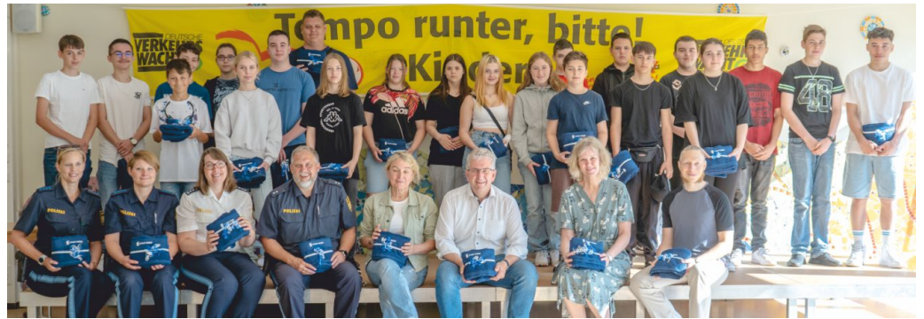
Gemeinsam für eine verantwortungsvolle Aufgabe im Einsatz – einen sicheren Schulweg.