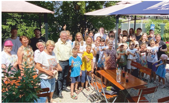
Die Gastfamilien und alle Beteiligten tun alles, um den kleinen Gästen vier unvergesslich schöne Sommerwochen und unbeschwerte Momente in Stein und Umgebung zu ermöglichen

Ziel der Erholungsaufenthalte ist es, die dauerhafte Strahlenbelastung der Kinder durch nicht strahlenbelastete Kost und Aufenthalte in frischer Luft zu reduzieren. Ein sorgloser und fröhlicher Ferienalltag fördert die psychische und körperliche Erholung und reduziert die Strahlenbelastung der Kinder nach vier Wochen nachweislich um über 80 Prozent“, so die Initiator:innen. Zur Begrüßung in der Fa-