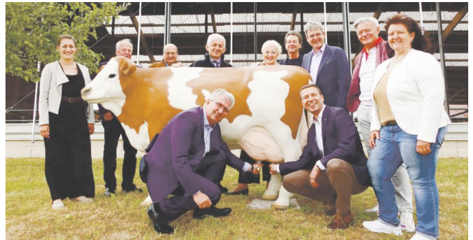
Ein neuer attraktiver und kurzweiliger Ausflugstipp direkt vor der Haustür: Entlang des über sieben Kilometer langen Rundwanderwegs warten 21 Tafeln und vier Mitmachstationen auf große und kleine Interessierte.

Vom Frühstücksei über den Hopfen bis hin zum Grillfleisch: Die Versorgung mit landwirtschaftlichen Produkten betrifft uns alle täglich und gilt als selbstverständlich. Auch in unserer Region sorgen Landwirte für die Produktion von Nahrungsmitteln und Energie sowie den Erhalt der Kulturlandschaft. Verbraucherinformation und Kommunikation mit Konsumenten ist heute genauso wichtig wie Tierwohl und Nachhaltigkeit.