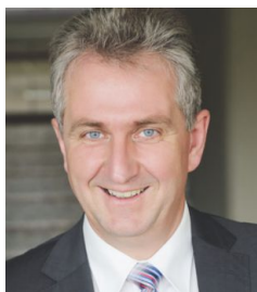
Kurt Krömer Erster Bürgermeister der Stadt Stein