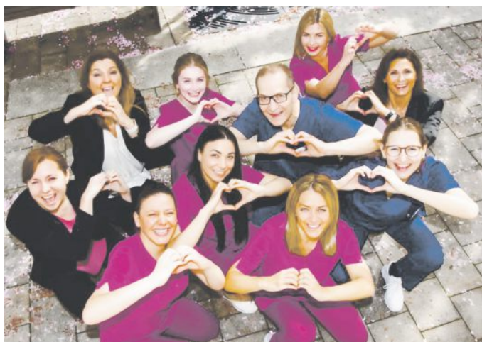
Unser Herz schlägt seit 30 Jahren für das Lächeln unserer Patientinnen und Patienten.