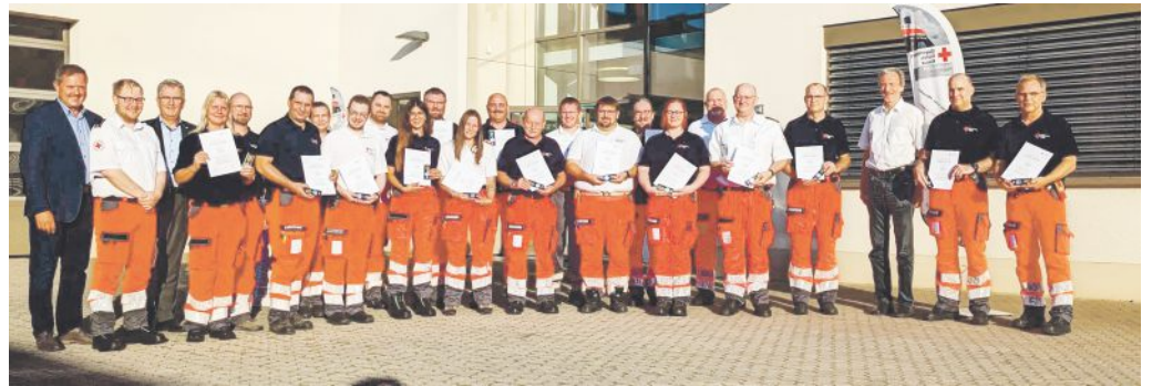
Verdiente Anerkennung und Ehrung für ihren Einsatz m Ahrtal.

Neun Helferinnen und Helfer der Steiner Bereitschaft waren damals als SEG Betreuung des BRK Kreisverband Fürth ausgerückt. Die mittelfränkischen Hilfeleistungskontingente – ein Zusammenschluss von mehreren solcher Einheiten – wurden in den rheinland-pfälzischen Landkreis Ahrtal geschickt. Dieser war damals mit 133 Todesopfern, unzähligen zerstörten Gebäuden und kaum noch benutzbaren Brücken, die am schlimmsten betroffene Region in Deutschland. Zwei solcher Einsätze, bei denen die Bevölkerung vor Ort mit Nahrung, dringend benötigten Artikeln des täglichen Bedarfs versorgt wurde und die auf jeweils vier Tage limitiert waren, wurden im Juli 2021 abgearbeitet.