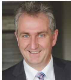
Kurt Krömer Erster Bürgermeister der Stadt Stein