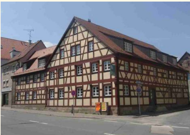
Mühlstr. 1

(Quelle: Text Waldemar Knaupp (†), Georg Büttner)