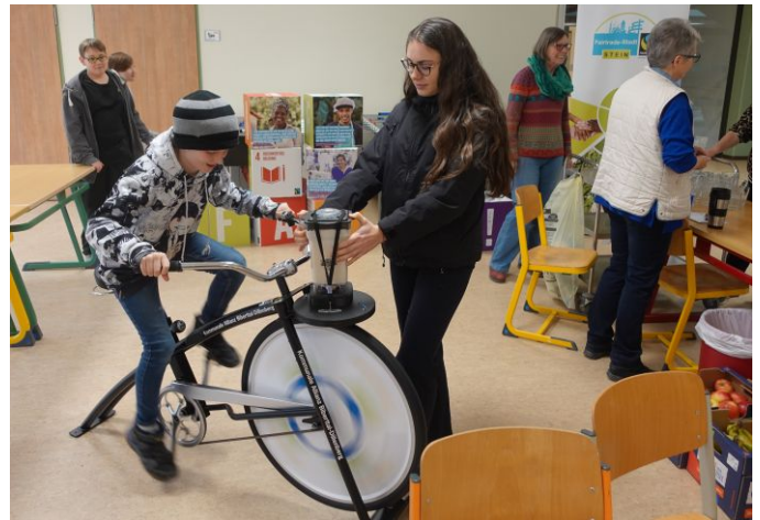
Die Schülerinnen und Schüler der Mittelschule Stein konnten sich mit eigener Muskelkraft faire & frische Smoothies erradeln