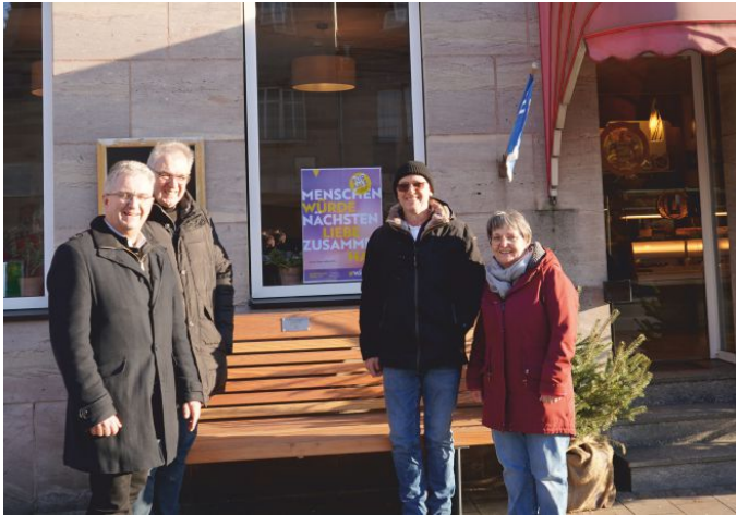
Einfach mal Platz nehmen und auf „Pause“ drücken.

Vor der Konditorei Mitterer gibt es eine neue Sitzgelegenheit – das „Kaffee-Bänkla“. Die Idee kam von der Konditorei selbst, die das Projekt in die Lenkungsgruppe des Projektfonds einbrachte und erfolgreich Fördermittel beantragte. Das „Kaffee-Bänkla“ schafft einen gemütlichen Rastplatz, der zum Verweilen und für Gespräche einlädt – ganz ohne Verzehrzwang. Die bisherigen Tische und Stühle waren in die Jahre gekommen und wurden durch die neue, hochwertige Bank ersetzt, die sich optisch an das Design der städtischen