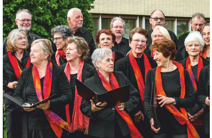
Voranzeige: Erleben Sie den Kammerchor bei seinem diesjährigen Sommerfest am 6. Juli, 19 Uhr im Gymnasium Stein