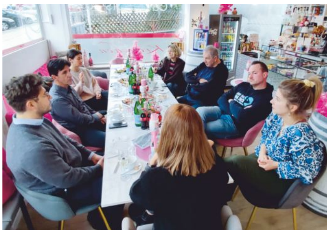
Frühstück, gute Gespräche, neue Ideen. Die Gewerbevereine im Landkreis Fürth ziehen an einem Strang.

Bei einem gemeinsamen Frühstück auf Einladung des Landratsamtes Fürth kamen Vertreterinnen und Vertreter der Gewerbevereine zusammen, um sich auszutauschen und Ideen für gemeinsame Aktivitäten zu entwickeln. Auch 2026 wird ein Schwerpunkt darauf liegen, die Wirtschaftsnetzwerke im Landkreis weiter zu stärken. Es folgende Maßnahmen geplant: