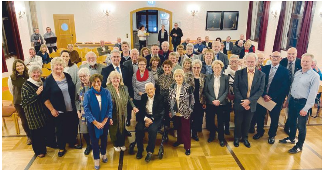
Ehrenamt hat viele Gesichter

Auszeichnungen mit der Ehrenamtsnadel in Gold für mindestens 30 Jahre Engagement.