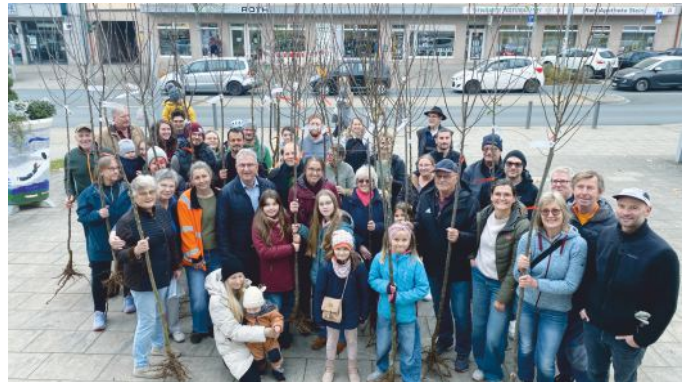
Ein Stück Zukunft in guten Händen, auf dem Weg ins neue Zuhause.

Die neuen Obstbäume, darunter verschiedene Apfel-, Birnen- und Zwetschgensorten, sind mit einer Stammhöhe von 170 bis 180 cm und einem Stammumfang von 7 bis 8 cm besonders robust und wurden in der Baumschule sorgfältig vorbereitet. Dank der zweifachen Verpflanzung in der Baumschule sind sie nun bestens gerüstet